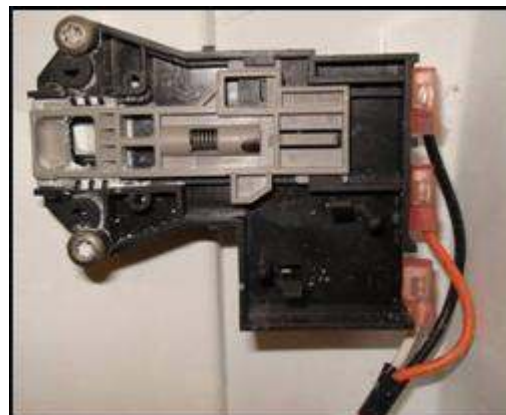
Ensamble LID LOCK C/SLIDER A 90 NVO y arnés cubierta con 3 terminales.